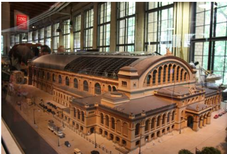
Das neue Dach

Bei der Dachgestaltung wurde darauf geachtet, dass der Betrachter neben einem Einblick in die Bahnhofshalle auch eine Vorstellung von der filigranen Dachkonstruktion erhält. Hierzu wurde in einem Bereich auf die Dachhaut verzichtet und nur die Trägerkonstruktion dargestellt.