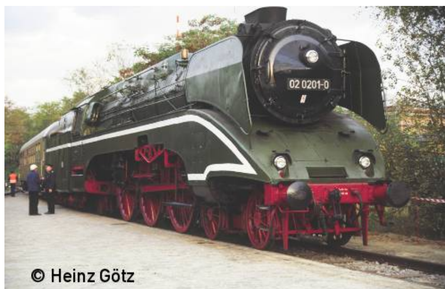
18 201 (02 0201-0) vor Drehscheibe I 1988

Die ehemalige Stromlinienlokomotive 61 002 des Henschel-Wegmann-Zuges, die schweren Güterzuglokomotiven der Baureihe 44 und der Baureihe 45 gaben die wichtigsten Bauteile, um daraus die Schnellzuglokomotive 18 201 herzustellen. Fertiggestellt 1961 im RAW Meinigen, diente sie in erster Linie der VES-M Halle (Versuchs- und Entwicklungsstelle-Maschinenwirtschaft) als Schnellfahrlokomotive mit dem Ziel Probefahrten für Reisezugwagen durchzuführen. Mit ihren Radsätzen von 2,30 m Durchmesser konnte sie eine Geschwindigkeit von 175 km/h erreichen und gilt heute noch als eine der schnellsten, betriebsfähigen Dampfloks der Welt. Als im Jahre 1988 die feierliche Eröffnung des Lokschuppen 2 stattfand, war die 18 201 der Star des Tages. Sie fuhr im Freigelände des Museums hin und her und hatte dabei den Halbspisewagen, der heute im Lokschuppen 2 steht, am Haken. Besucher konnten dabei auf dem Führerstand mitfahren. (db)