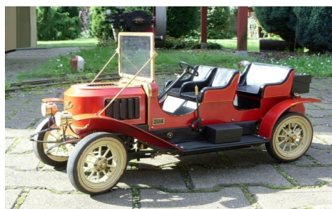
Modell eines Dampfwagen der Firma Stanley (USA) aus dem Jahr 1906-Modell im Maßstab 1 : 8

Eine Aktion des Arbeitskreises Dampf der „Freunde und Förderer des Deutschen Technikmuseums Berlin e.V.“